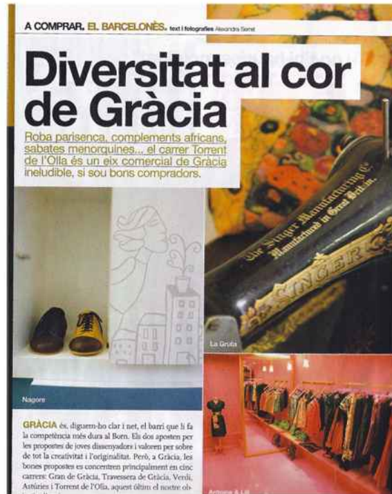
"Sortim" suplemento periodico AVUI, nº102 - 28/9/2007 - pg.42