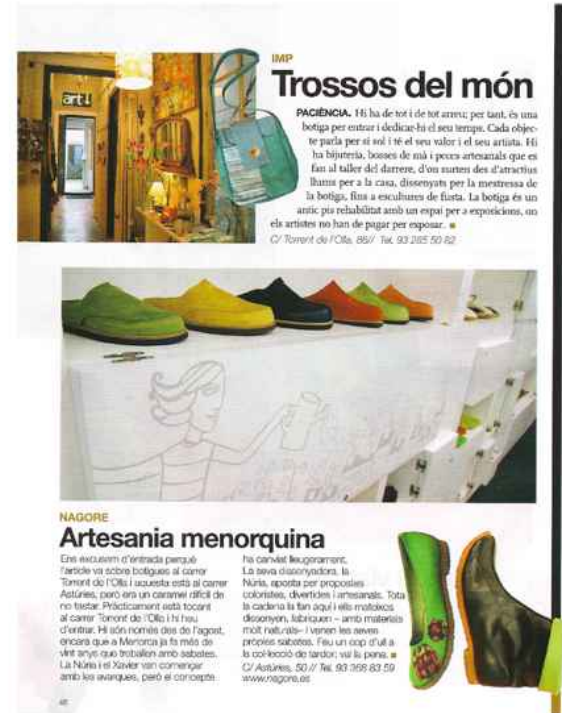
"Sortim" suplemento periodico AVUI, nº102 - 28/9/2007 - pg.46